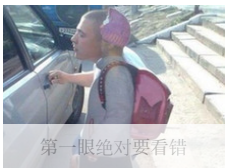
第一眼绝对要看错