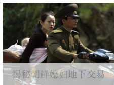
揭秘朝鲜媳妇地下交易