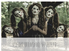
吓破胆的诡异照片