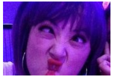
看明星闪瞎眼的自拍照