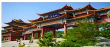
“美丽的长江城市·重庆渝中”