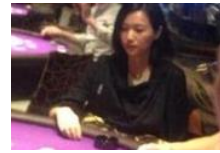
爱光顾赌场的明星