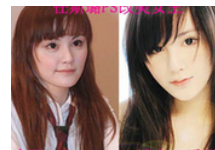
女星未PS前后照显杯具